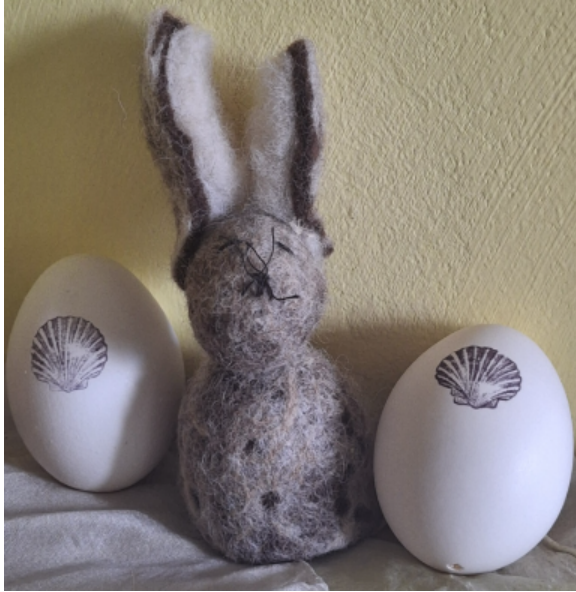
ausgeblasene Eier mit Pilgerzeichen + Hase